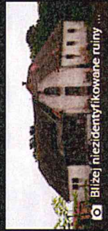
Bliziej niezidentyfikowane ruiny ...