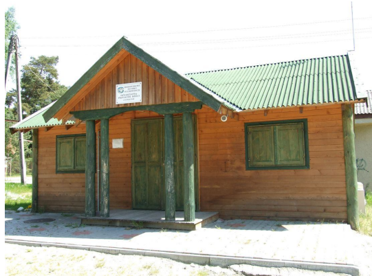
zdjęcie nr 4 *

Na terenie Łukęcina brak jest obiektu oświatowego