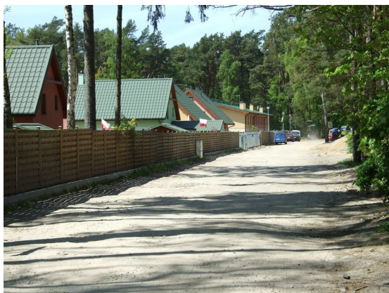
zdjęcie nr 3*

Baza noclegowa gminy liczy trzydzieści tysięcy miejsc i obejmuje hotele, ośrodki wypoczynkowe i kolonijne, pensjonaty, pola kempingowe, kwatery prywatne i schronisko młodzieżowe. Pomimo, iż w miejscowościach gminy najludniej jest w okresie sezonu letniego, to wiele z ośrodków i hoteli prowadzi działalność całoroczną.