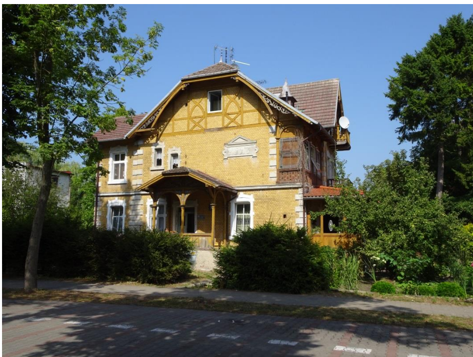
Dziwnów - willa przy ul. Parkowej 5, z otoczeniem – pocz. XX w. - nr rej. 293 – Dec. DZ-4200/02/O/2006 z 14.12.2006 r.