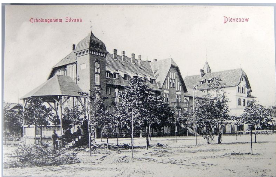
Dziwnów - pensjonat przy ul. A. Mickiewicza 3, z otoczeniem – IX/XX w. - nr rej. 1312 – Dec. DZ-4200 /30/O/97 z 09.10.1997 r.