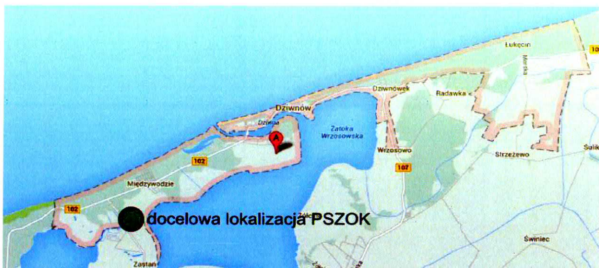
Ryc. 1. Lokalizacja PSZOK na terenie Gminy Dziwnów

walory turystyczne gminy. Do chwili utworzenia PSZOK, na terenie gminy funkcjonuje punkt tymczasowy zlokalizowany w Międzywodziu przy ulicy Armii Krajowej (ryc. 1).