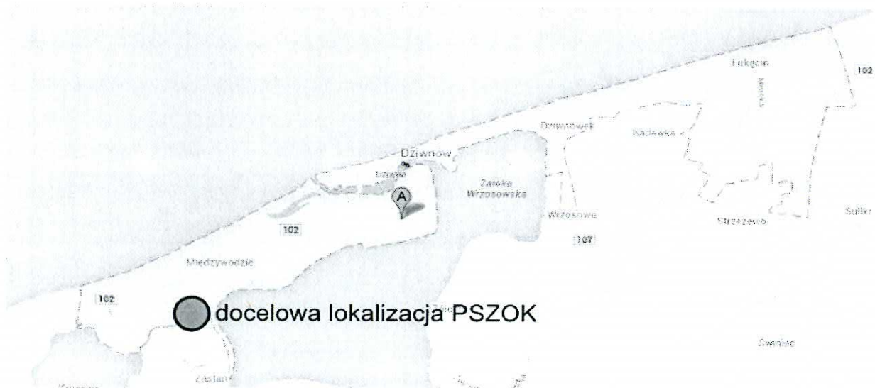
Ryc. 2. Docelowa lokalizacja PSZOK na terenie Gminy Dziwnów

Docelowo PSZOK zlokalizowany ma być przy oczyszczalni ścieków w miejscowości Międzywodzie (Ryc. 2). Wyznaczona lokalizacja PSZOK spełnia wymóg łatwego dostępu dla mieszkańców gminy, ponieważ znajduje się w niewielkiej odległości od największej miejscowości gminy oraz zlokalizowana będzie przy drodze asfaltowej. Jednocześnie punkt oddalony jest od miejsc związanych z wypoczynkiem i przebywaniem turystów, w związku z czym ograniczone zostanie negatywne oddziaływanie PSZOK na walory turystyczne gminy.