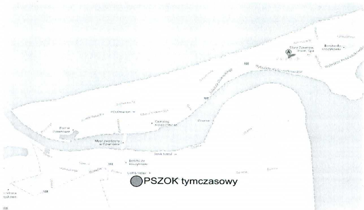
Ryc. 1. Lokalizacja PSZOK tymczasowego na terenie Gminy Dziwnów

Docelowo PSZOK zlokalizowany ma być przy oczyszczalni ścieków w miejscowości Międzywodzie (Ryc. 2). Wyznaczona lokalizacja PSZOK spełnia wymóg łatwego dostępu dla mieszkańców gminy, ponieważ znajduje się w niewielkiej odległości od największej miejscowości gminy oraz zlokalizowana będzie przy drodze asfaltowej. Jednocześnie punkt oddalony jest od miejsc związanych z wypoczynkiem i przebywaniem turystów, w związku z czym ograniczone zostanie negatywne oddziaływanie PSZOK na walory turystyczne gminy.