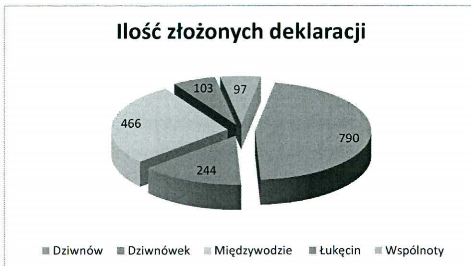
Wyk.1. Ilość złożonych deklaracji