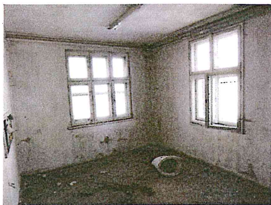
Fot. 4. Budynek biurowy.