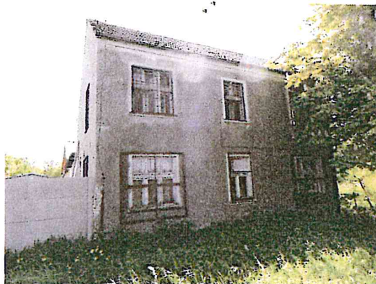
Fot. 2. Budynek biurowy.