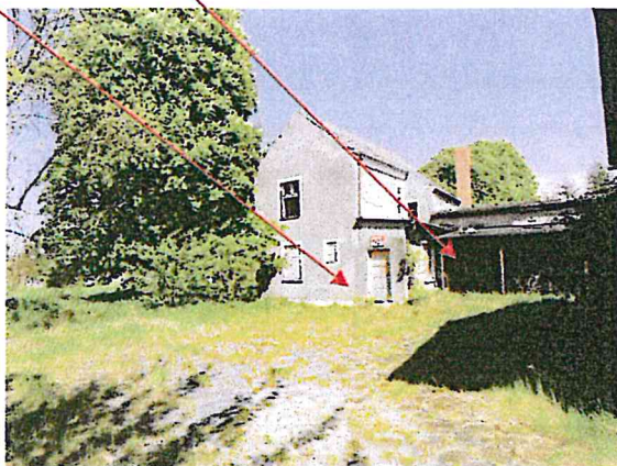
Fot. 1. Budynek biurowy z magazynowym.