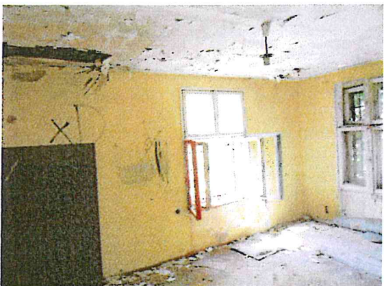
Fot. 5. Budynek biurowy.