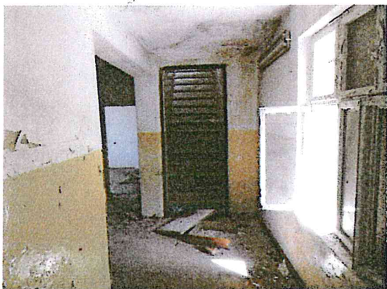
Fot. 3. Budynek biurowy