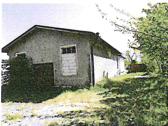
Fot. 7. Budynek magazynowy.