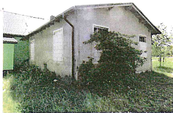
Fot. 8. Budynek magazynowy.