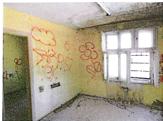
Fot. 6. Budynek biurowy.