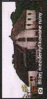
Bliziej niezidentyfikowane ruiny ...