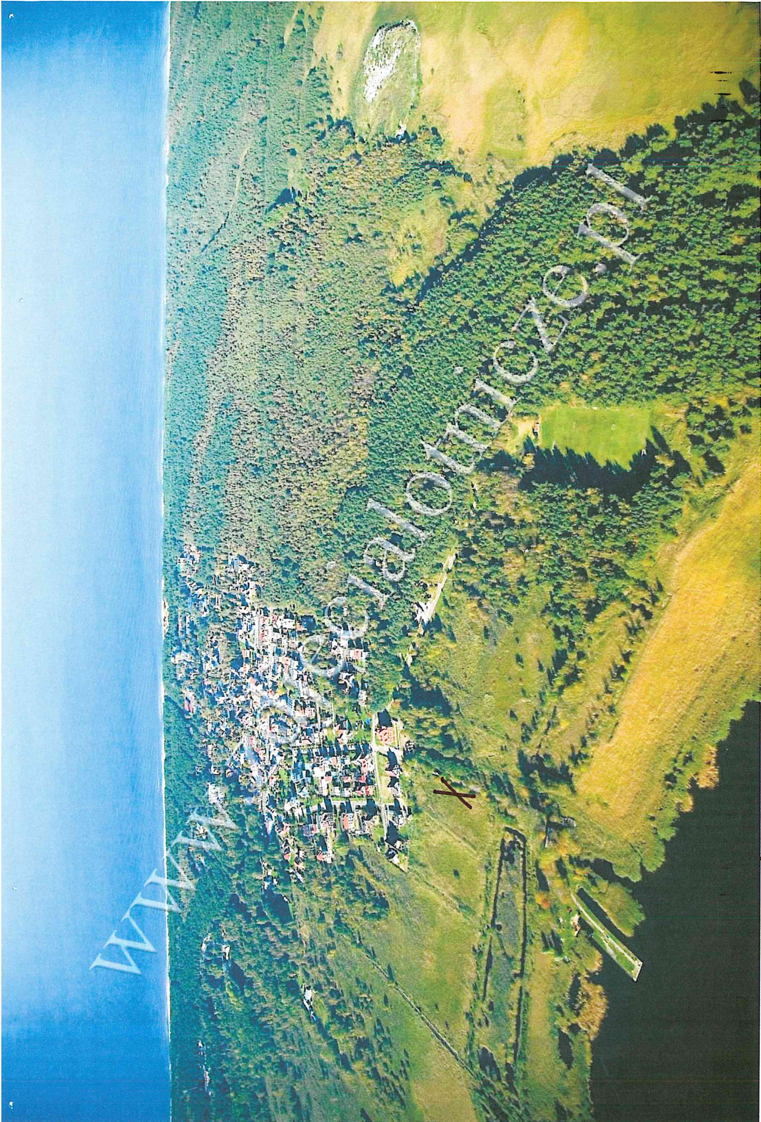
X DZIAŁKA NA SPRZEDAŻ